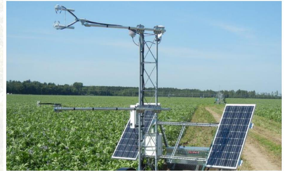
Eddy Covariance (EC) asema

→ Toimivat mallit ja hyvät tulokset kaikkien sopimustuottajien tietoon ja käyttöön